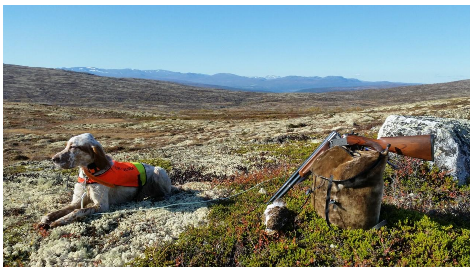
Stemmingsbilde fra høstens jakt.