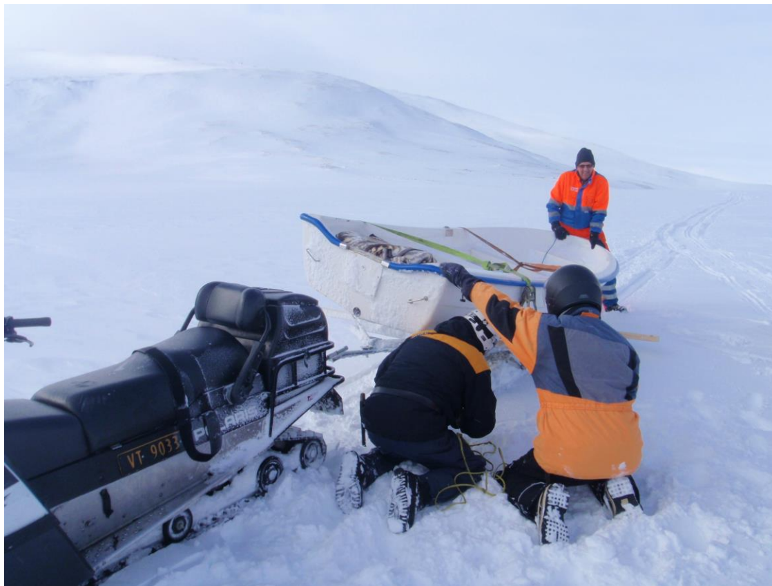
Fjellstyreleder og et styremedlem kjører inn båten til Litj-hiåsjøen etter reparasjon.

Det er for året 2017 avholdt 3 ordinære styremøter. Totalt er det behandlet 14 saker.