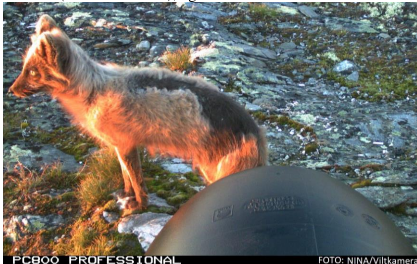
Figur 1 Denne blå varianten ble fotografert ved den ene fôringsstasjonen i Forollhogna den 29.6.17

Støtteforinga av fjellrev i Forollhogna, som startet opp vinteren 2012, har pågått også i 2017. De to fôrstasjonene i Forollhogna har vært flittig besøkt av minst en hvit og en blå variant av fjellrev i løpet av vinteren 2016/17. I 2017 ble det ikke registrert hiaktivitet av fjellrev på vinteren (31 hi kontrollert), og bare aktivitet ved ett hi sommerstid.