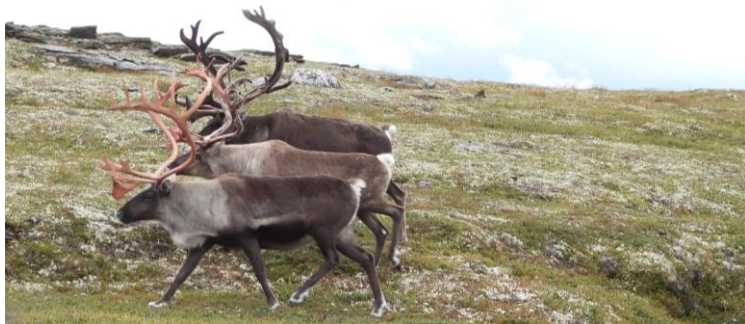
Bukker på Svartsjølikletten i jakta.

Det ble felt 17 (18) rein på disse kortene, noe som gir en fellingsprosent på 85 % (94,7 %). I 2015 innførte Fjellstyret mulighet for å søke om lagsjakt under villreinjakta, dette var også mulig i 2020.