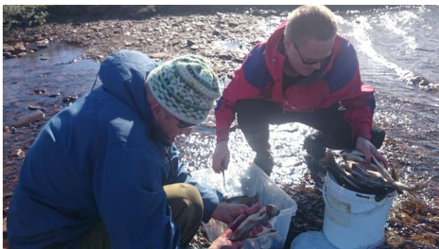
Garnfiskere ved Litj- hiåsjøen sommeren 2015.

Kvikne fjellstyre har båt og garn ved Litj-Hiåsjøen som leies ut per døgn. Dette medførte inntekter på kr 1 700 i 2015. (kr.1740,-). Det utføres jevnlig tilsyn, etterfylling og nødvendig søppeltømming i buene.