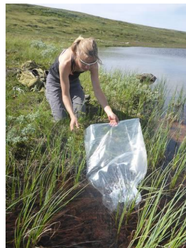
Utsett av fisk i N. Langvatnet 2015.

Leieinntekter på båt/garn/hytte ble på kr 3 050,- (8 585,-). Det var fem